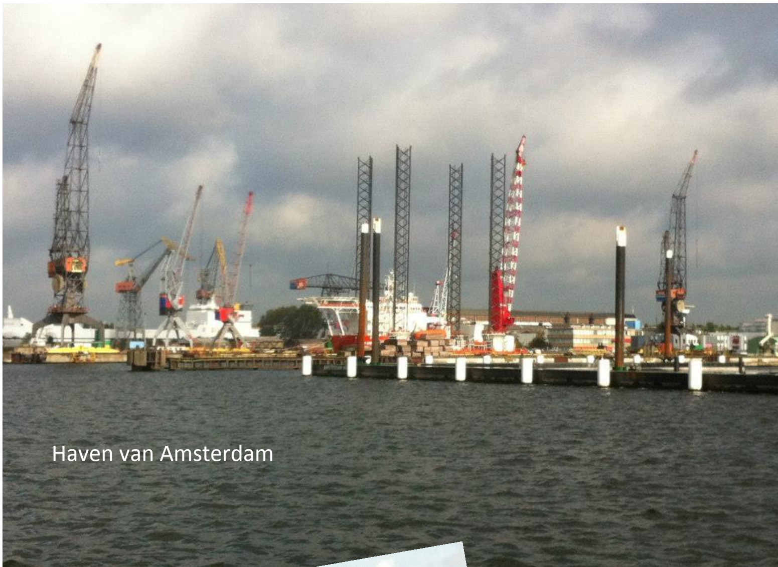
Haven van Amsterdam